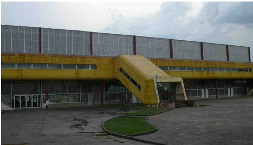
Image du gymnase « les hauts d'Auxerre » ou photo du film « les Langoliers » S. King (2)

Je ne mets pas longtemps pour rejoindre les vestiaires et c'est en musique que je revêts ma tenue de wushu.