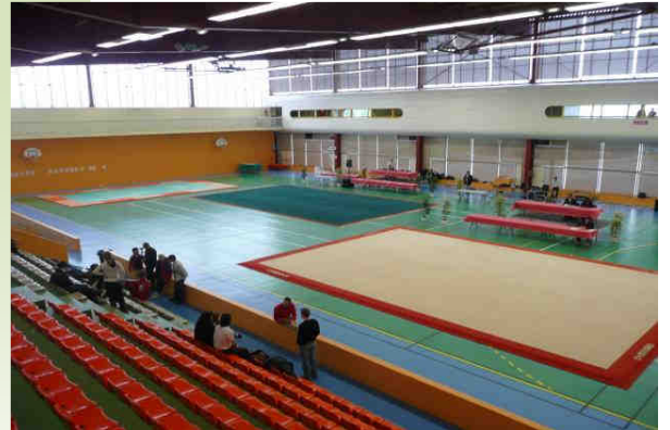
Aménagement du gymnase (1)