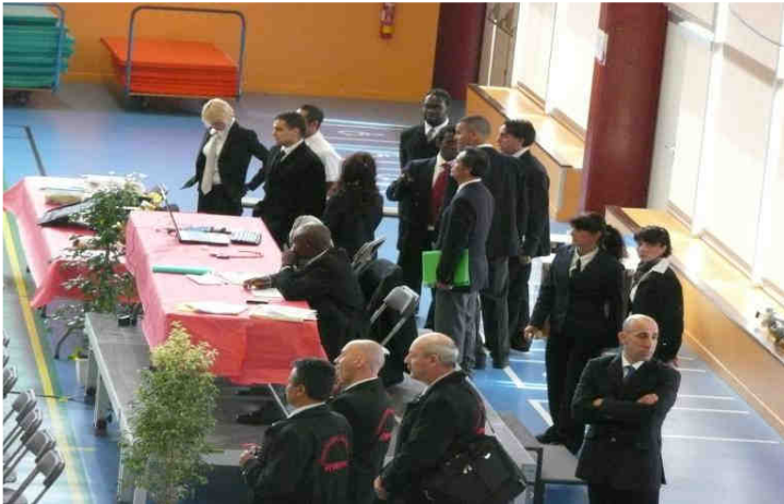
Corps arbitral en observation (3)

Le gymnase est encore désert, il n'y avait que quelques compétiteurs que je ne connais pas, du moins pas encore.