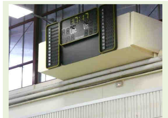
Fin de la compétition (16)

Textes, rédaction, mise en page, graphique, B. Bergé-Turpin