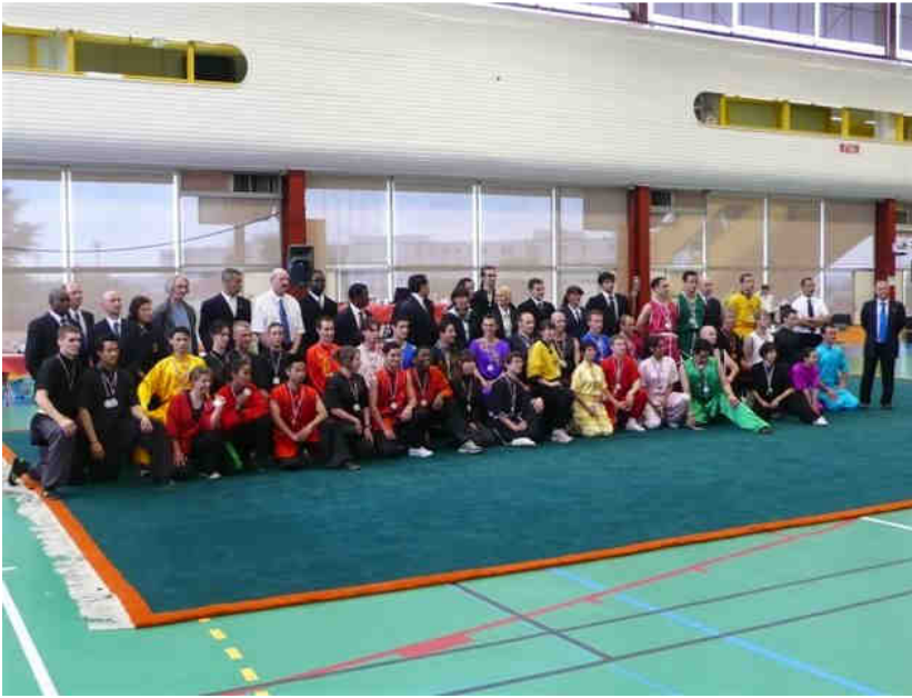
Les compétiteurs traditionnels (6)

Classement national...de la compétition taolu traditionnelle et participation par région.