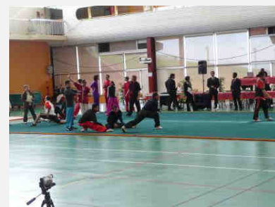
Échauffement compétiteurs en moderne sur tapis chinois (10)