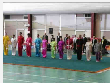
Compétiteurs chan quan (11)