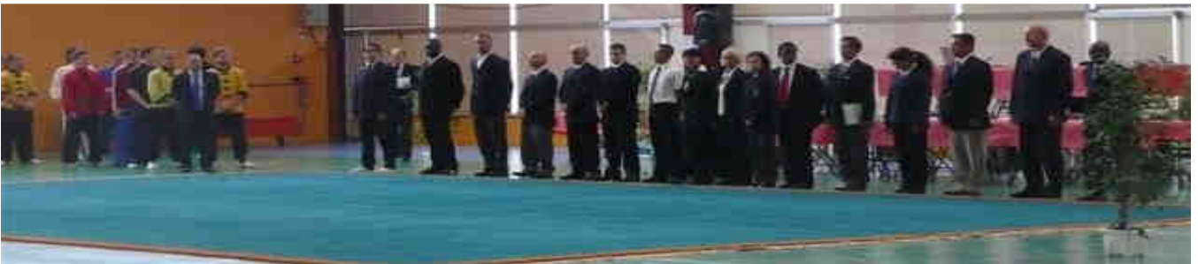
Protocole du corps arbitral et appel des premiers compétiteurs (4)

Une musique de chansons chinoises rajoute une ambiance de fête, on se croirait en Chine !