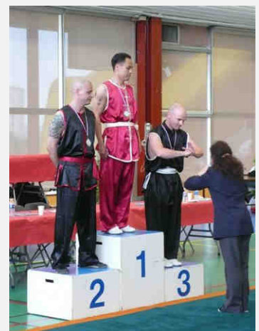
Remise de médailles (9)