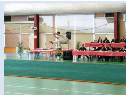
Autre compétiteur en suspension (13)