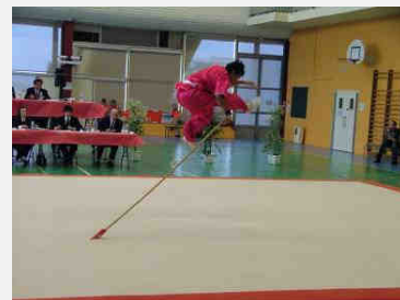
Compétiteur en suspension (12)